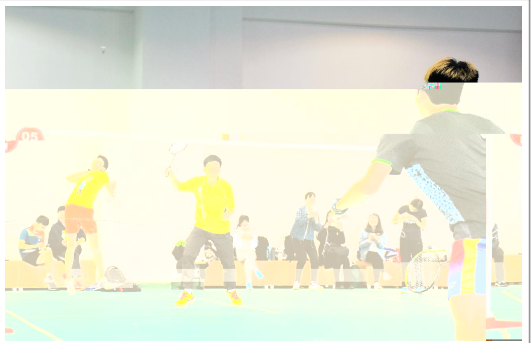
4- 8. /2017Q 232456 789: ; <=>?@ABCD= EFGHI /J KD= LM$ NOPQR9: STPQU 122VSWXYZ[ \V] ^_` aBbcdef ghij kl m>nopL qr EFst luvEFst wxryEUz { R| } ~• a

%10 _ mt d $stu [! %B 中 \ 上 L B 中 U U_ 力$ 海市 .第 '{ % O立 B 中 r ; 技 技 A B d` a机c$ j $中 d B %; B " 任 U $t U K O%&' O" LO%( ) 任 C任 UK * + # $&