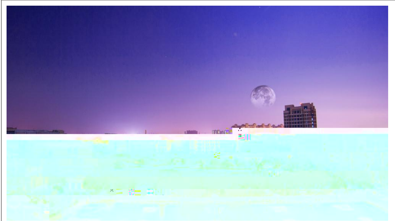
Q 张劲杰 \ 摄