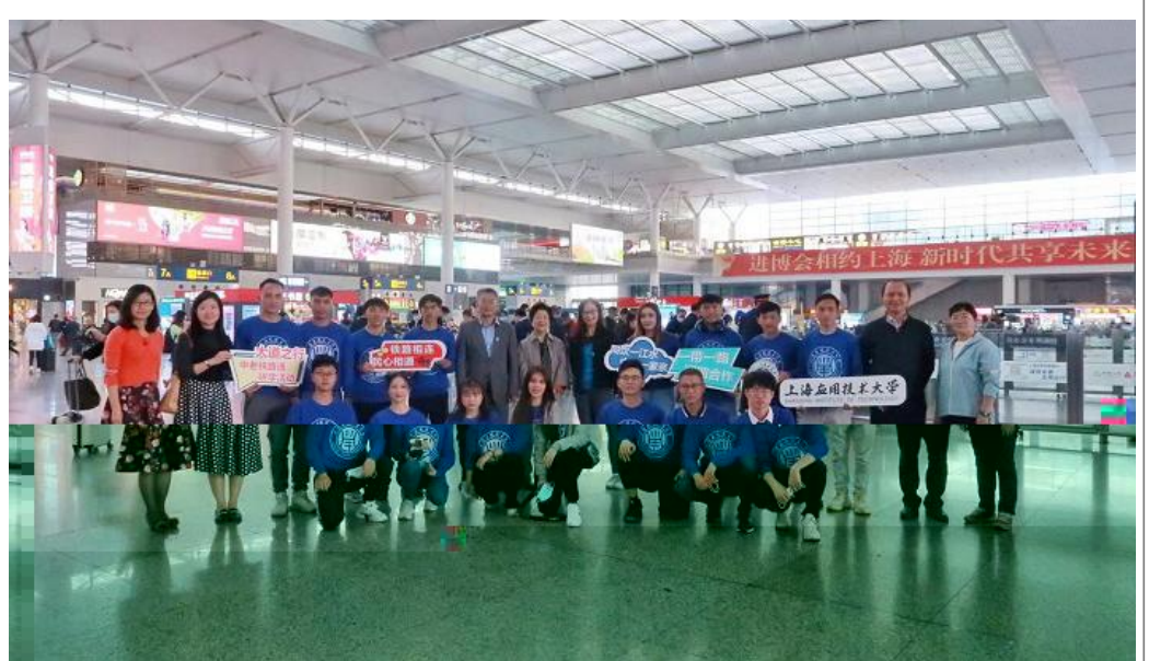
11月19日,我校2018级老挝留学生启程回国赴中老铁路现场开展实习。轨交学院同时开启“一带一路澜湄合作‘大道之行’”研学活动。图为老挝留学生与前去送行的领导、教师合影留念。

v月活=, Q大学y 正 X= oB 的X= 质。 W届j v月>E新 新 vG主题,活=b `a, $ ,zV 举 E6书7 vb 讲@658 |库 上新6 H J销6\B\ 的6书76j 书} 会CE 论 GS作大 j S& A,中z 6书、(o(> /Sxy 理上海6书7j Pd* 活=, `a校dz{ ,d s -新特色 v, m( vb ,t~ xy v|),更 i S学校教学、a研B学a建$ 精^ v。 (图书馆供稿)